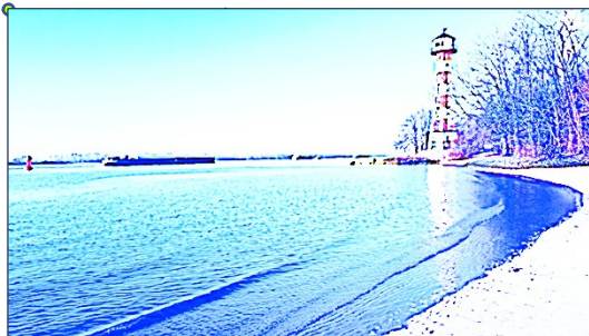
A Leuchtturm , (Effekte, Bildelemente u. Schrift eingefügt von Mary Muster ), CC BY-SA 4.0