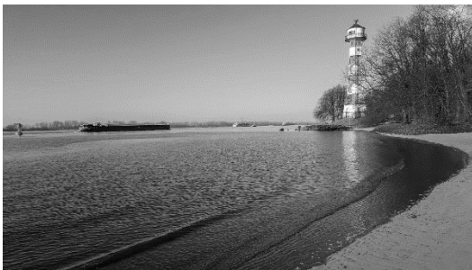
Foto: BugFix , UP Hamburg Elbe Leuchtturm , (umgewandelt in s/w), CC BY-SA 4.0