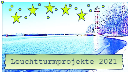
Abb.: BugFix , UP Hamburg Elbe Leuchtturm , (Effekte, Bildelemente u. Schrift eingefügt von Mary Muster), CC BY-SA 4.0