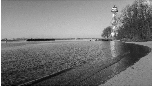
Foto: BugFix, UP Hamburg Elbe Leuchtturm, (umgewandelt in s/w), CC BY-SA 4.0