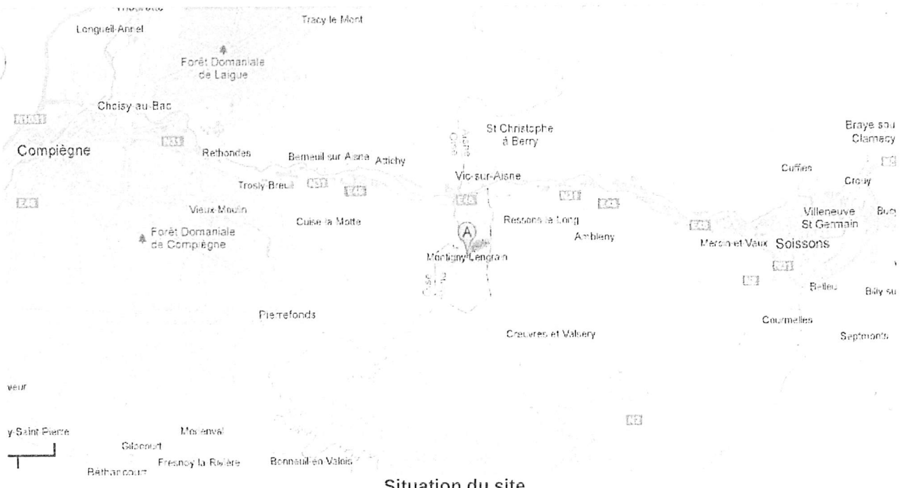
Situation du site