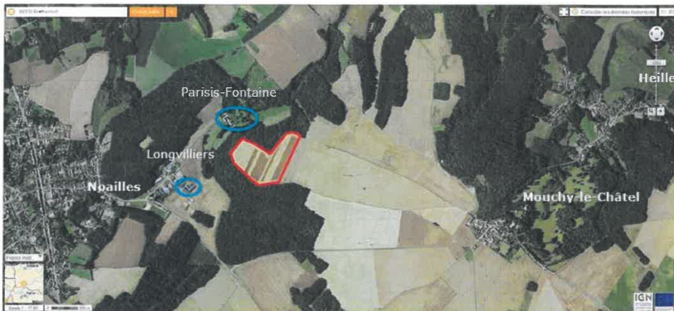
Carte de localisation des ZER (en bleu) les plus proches du projet (en rouge)