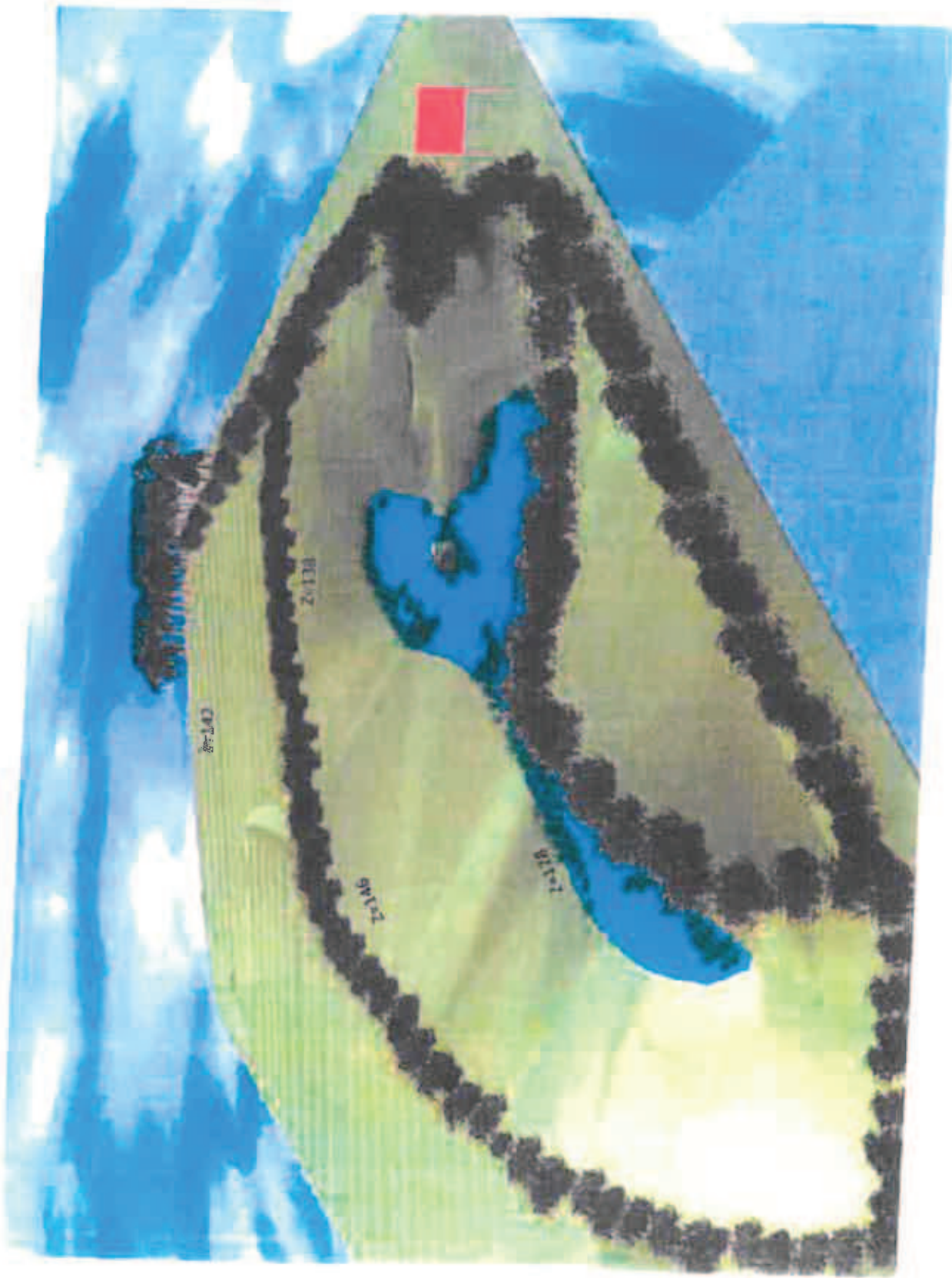
Figure 2: Nouveau projet d'état final