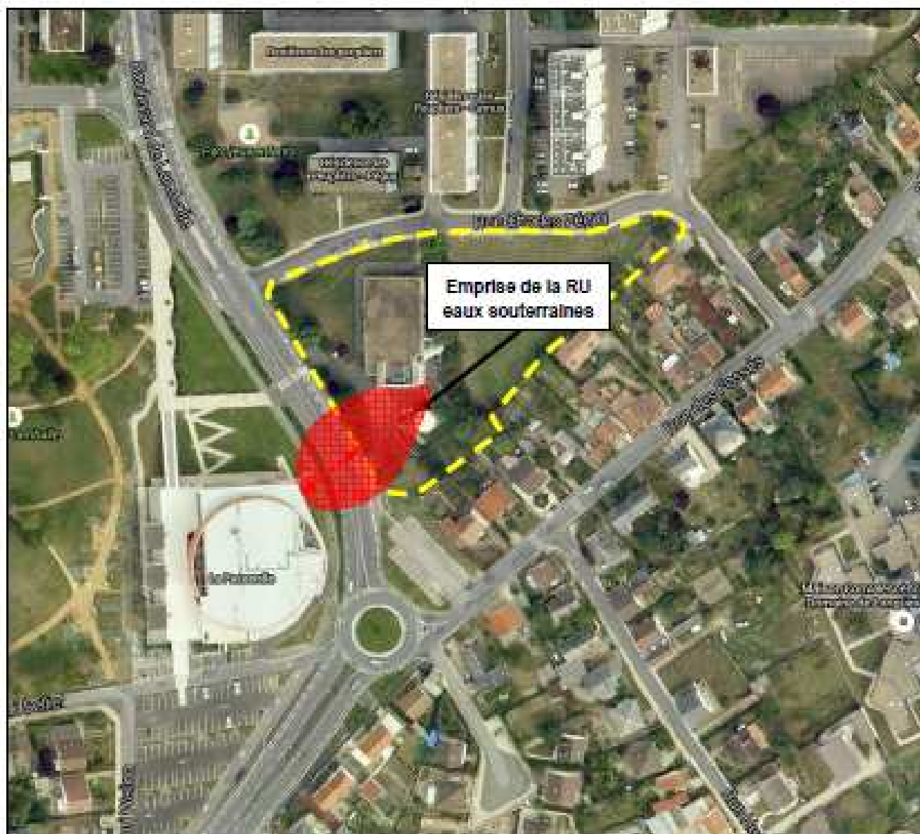
FIGURE 15 : EMPRISE DE LA RESTRICTION D'USAGES (RU) POUR LES EAUX SOUTERRAINES.