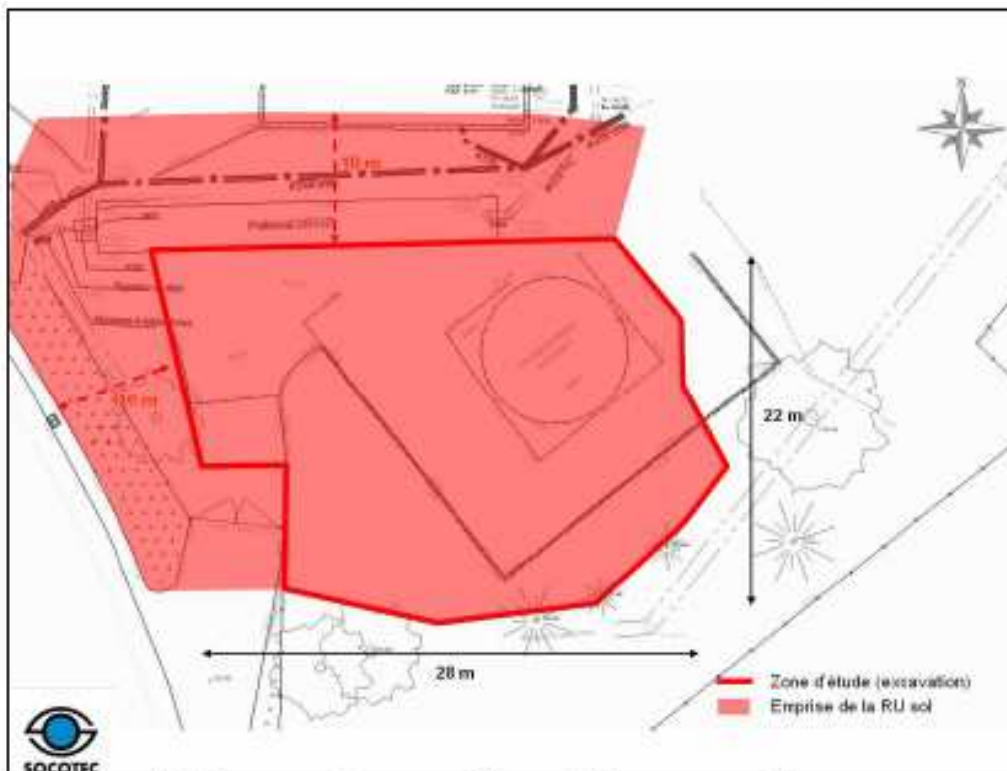
FIGURE 14 : EMPRISE DE LA RESTRICTION D'USAGES (RU) POUR LES SOLS – VUE DÉTAILLÉE