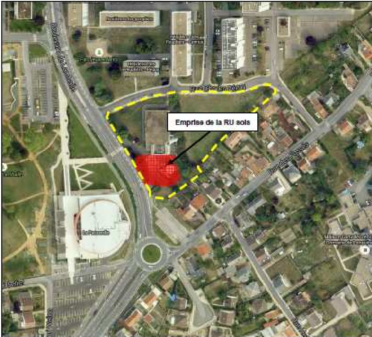
FIGURE 13 : EMPRISE DE LA RESTRICTION D'USAGES (RU) POUR LES SOLS – VUE GLOBALE