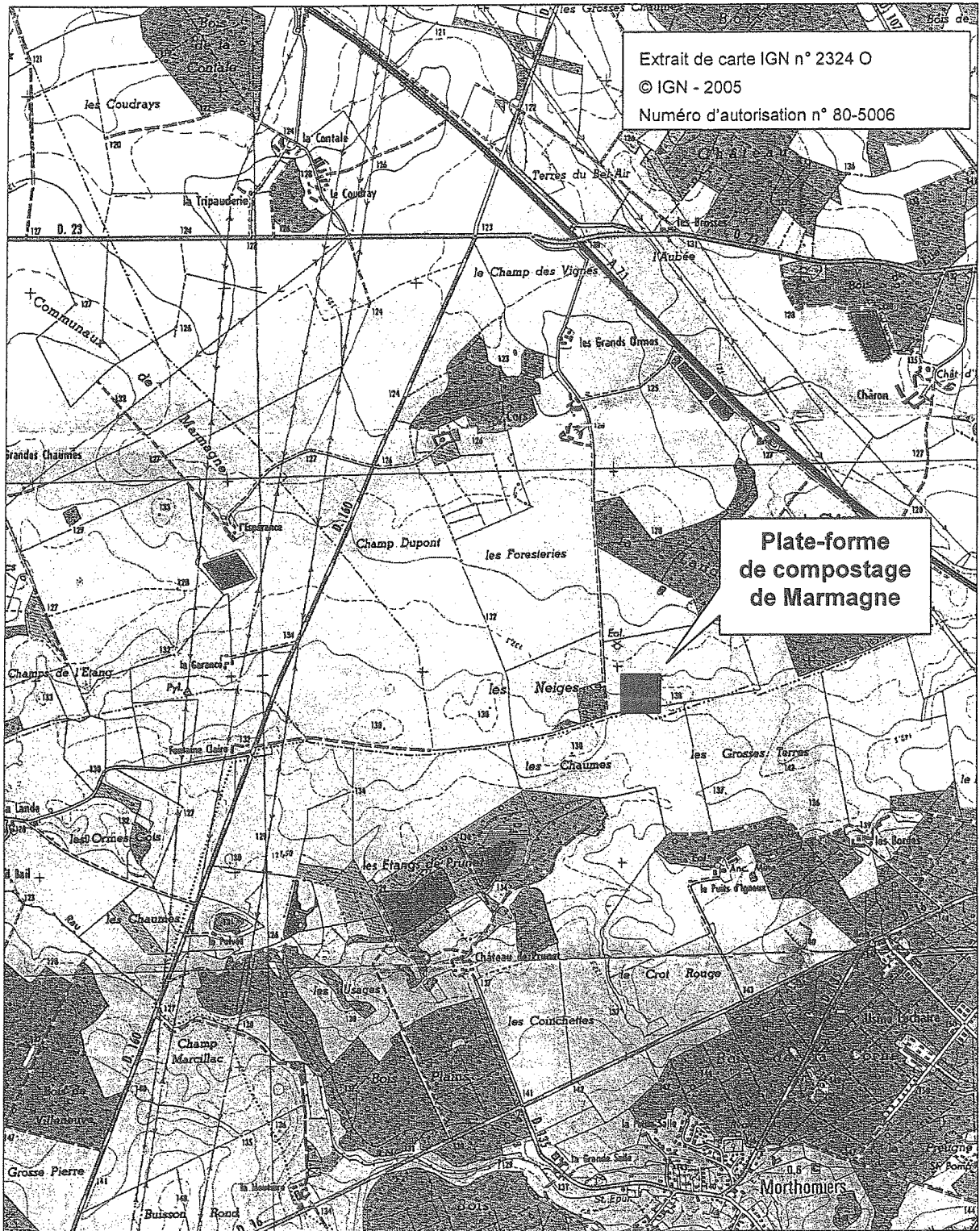
Localisation du site