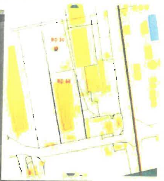
Extrait du cadastre