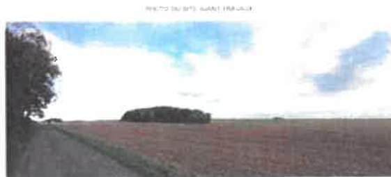
SAS BIOMARNE - Parcelle n° 2 - Section ZN 51120 LES ESSARTS-LES-SEZANNE INSERTION DES OUVRAGES DANS LE PAYSAGE IMPACT VISUEL