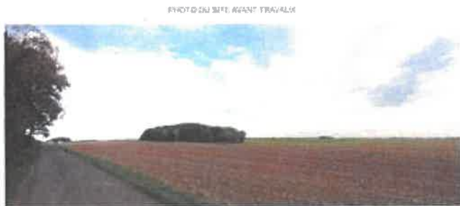
SAS BIOMARNE - Parcelle n° 2 - Section ZN 51120 LES ESSARTS-LES-SEZANNE INSERTION DES OUVRAGES DANS LE PAYSAGE IMPACT VISUEL