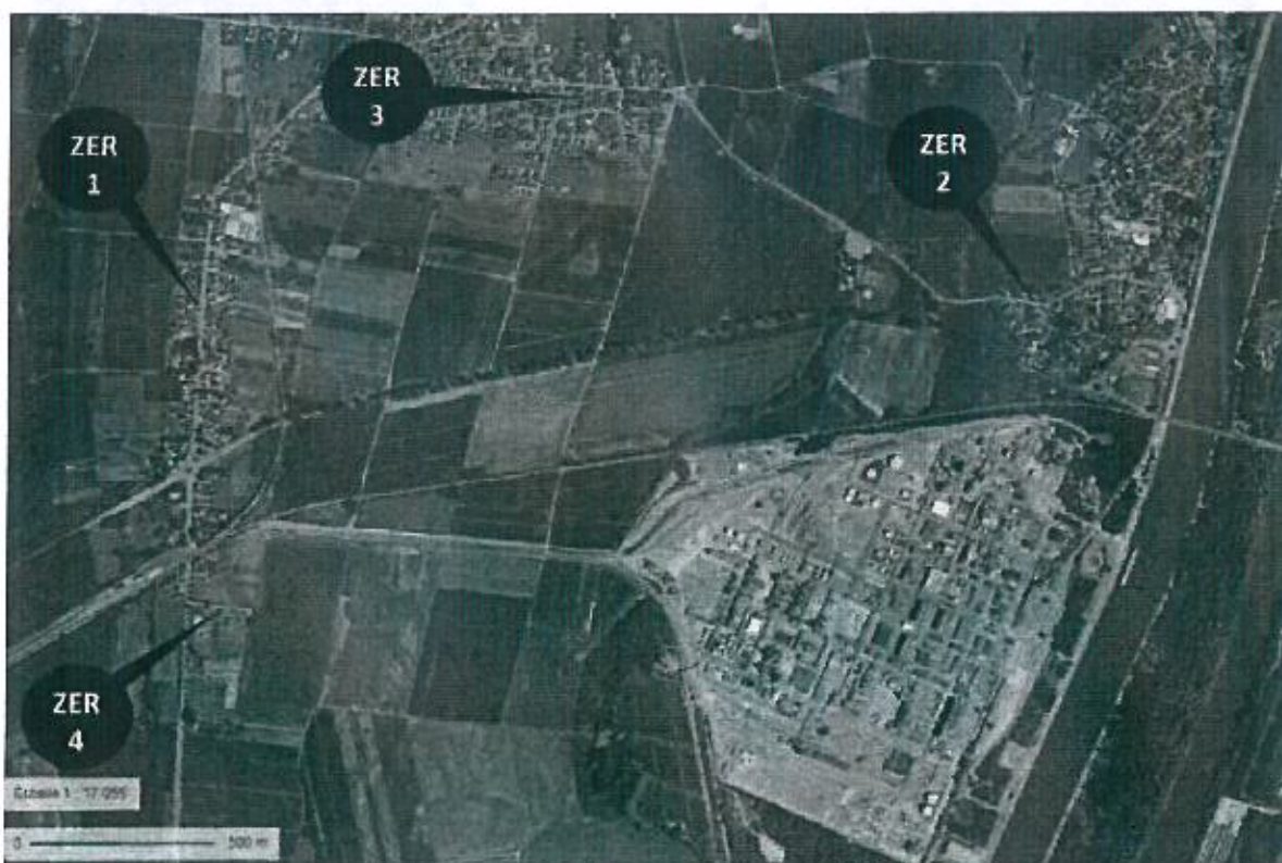
Localisation des Zones d'Emergence Réglementées (ZER)