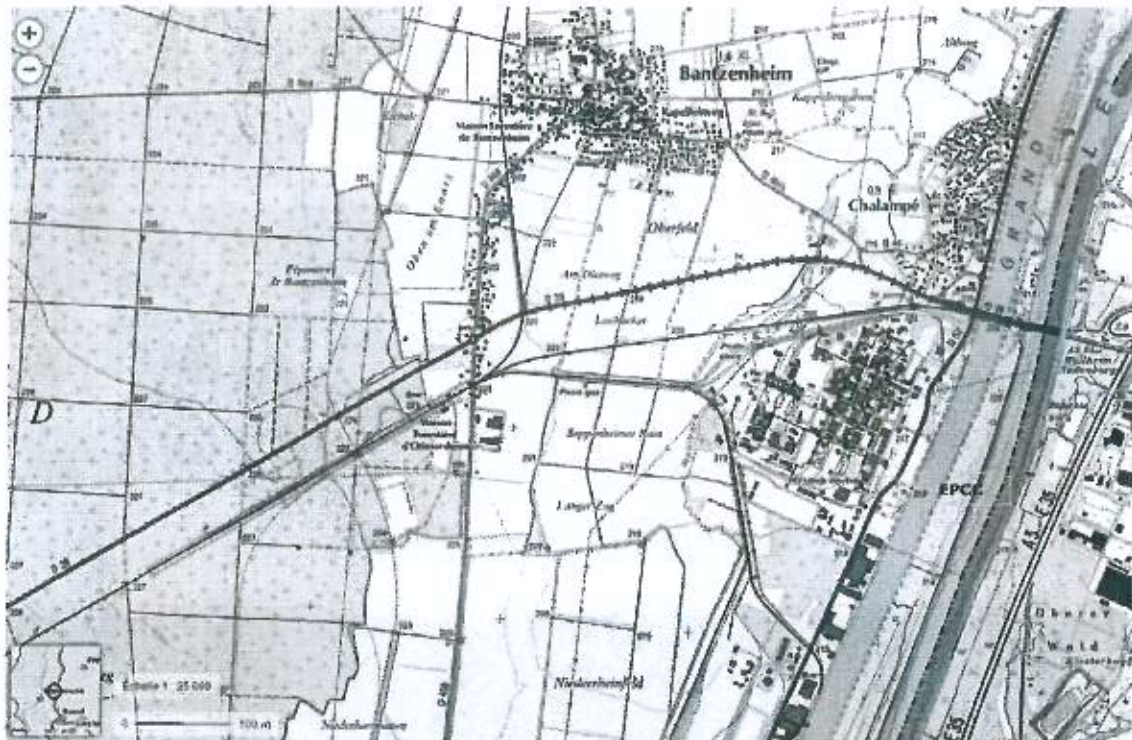
Plan de situation de l'EPCC