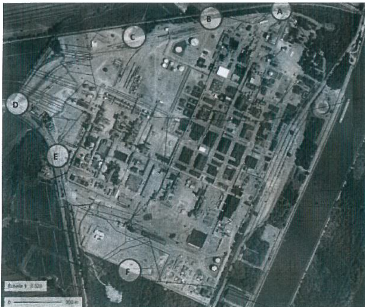
Localisation des points de mesures acoustiques