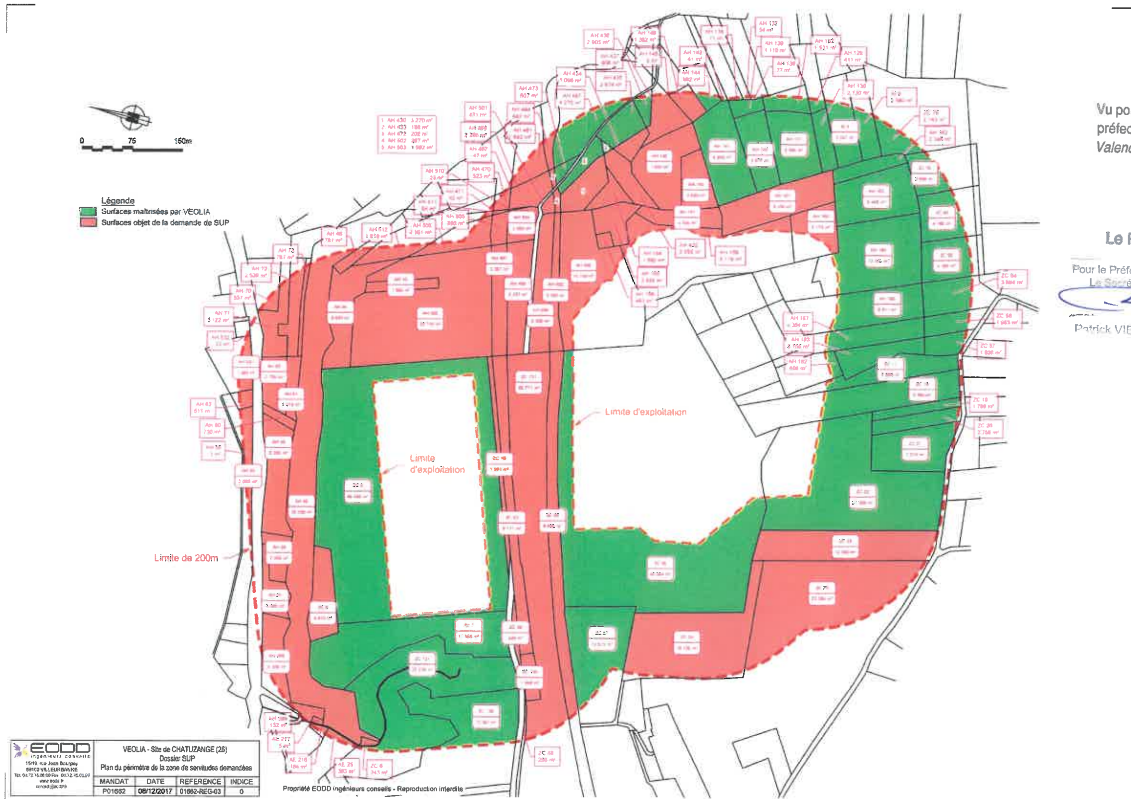
Figure 4 Plan du périmètre et localisation cadastrale de la demande SUP projet de continuité du PSE de Chatuzange-le-Goubet