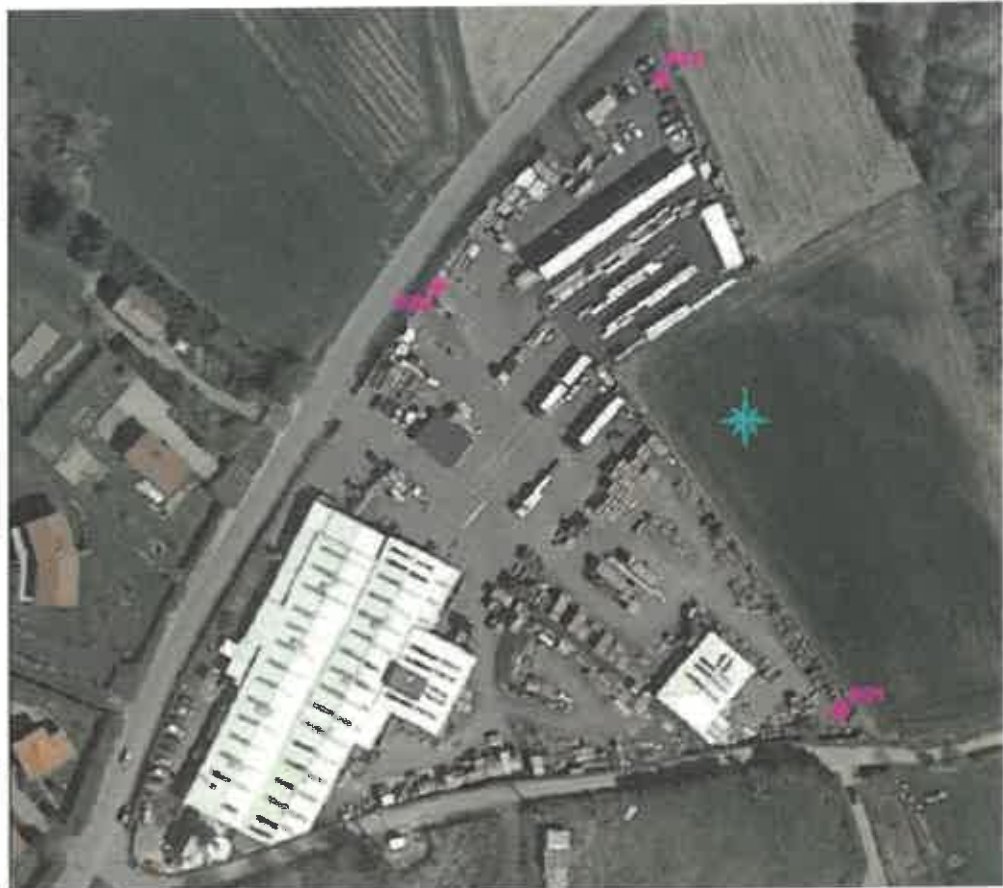
Implantation de piézomètres pour surveillance hydrogéologique