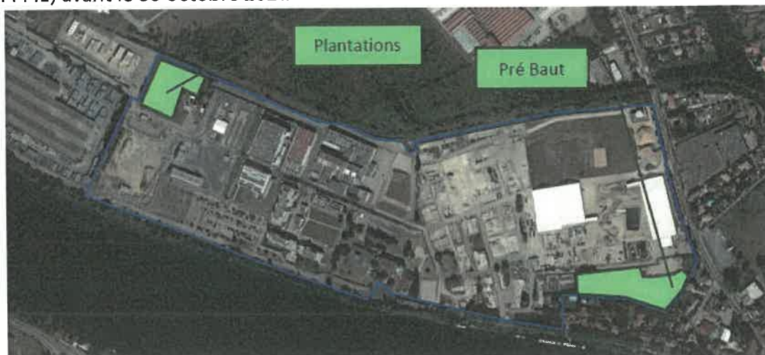
Localisation des mesures ME 01, MR 02 et MS 01:

Des inventaires complémentaires faune-flore sont conduits sur le site matérialisé (contour bleu), de façon à couvrir totalement un cycle biologique. A l'issue de ces prospections, les enjeux sont réévalués et, le cas échéant, des mesures correctives sont proposées. Le rapport de synthèse est transmis à la DREAL (EHN / EPME) avant le 30 octobre 2021.