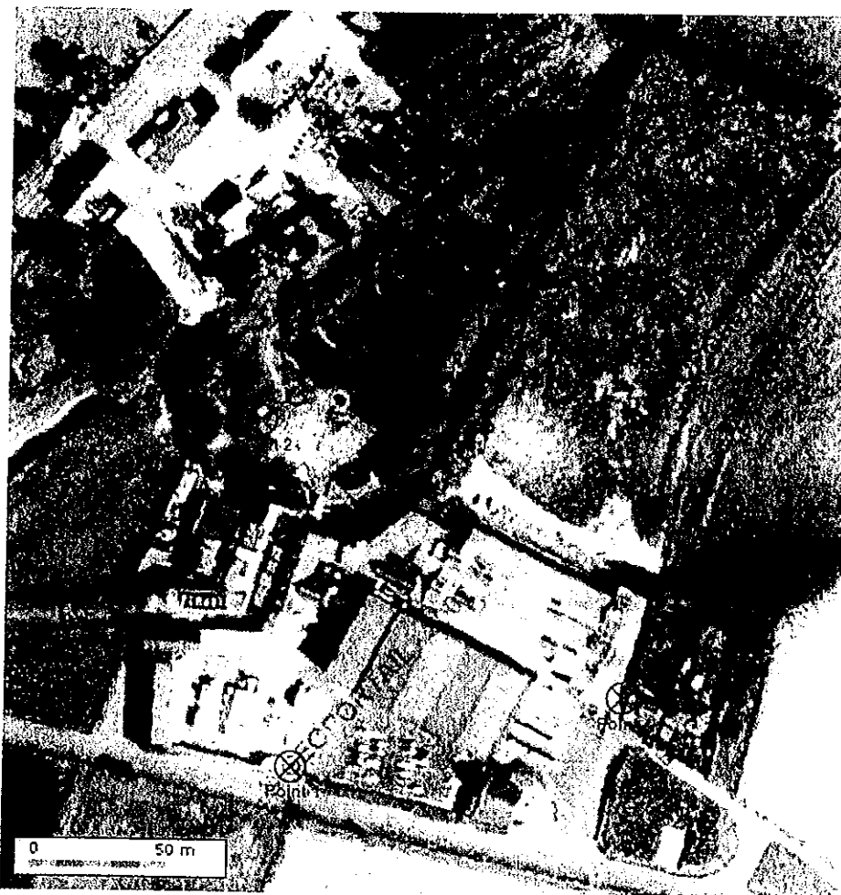
Figure 23 : Plan des points de mesurage