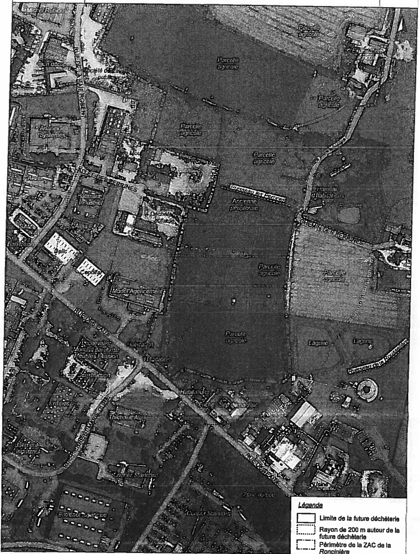
Figure 5 : Plan des abords de l'installation dans un rayon de 200 m