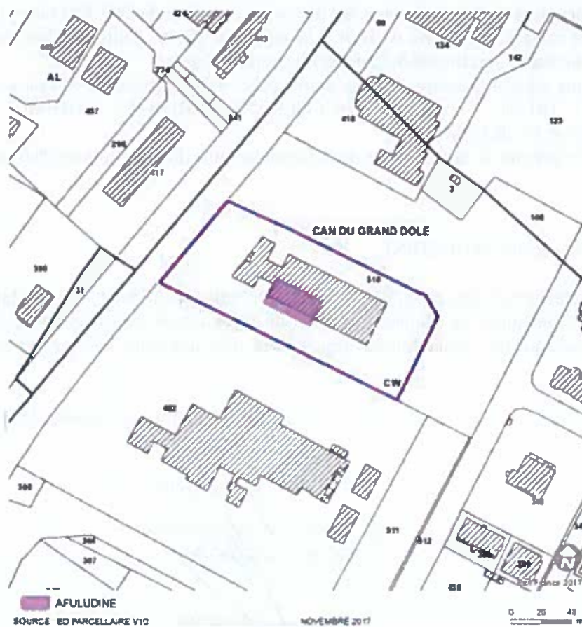
Illustration n° 2 : Extrait du cadastre