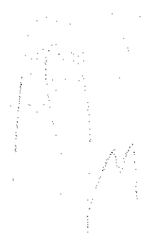
Figure 1: A line graph showing the relationship between variables X and Y. The x-axis represents variable X and the y-axis represents variable Y. The data points indicate a positive correlation, with Y increasing as X increases.

The first part of the document discusses the importance of maintaining accurate records of all transactions. It emphasizes that every entry should be supported by a valid receipt or invoice. This ensures transparency and allows for easy verification of the data. In the second section, the author details the various methods used to collect and analyze the data. This includes both manual and automated processes. The goal is to ensure that the data is both reliable and representative of the overall population being studied. The third part of the document focuses on the results of the analysis. It shows that there is a clear trend in the data, which is consistent with the initial hypothesis. This finding is significant as it provides strong evidence for the theory being tested. Finally, the document concludes with a summary of the findings and some recommendations for future research. It suggests that further studies should be conducted to explore the underlying causes of the observed trends and to test the model under different conditions.