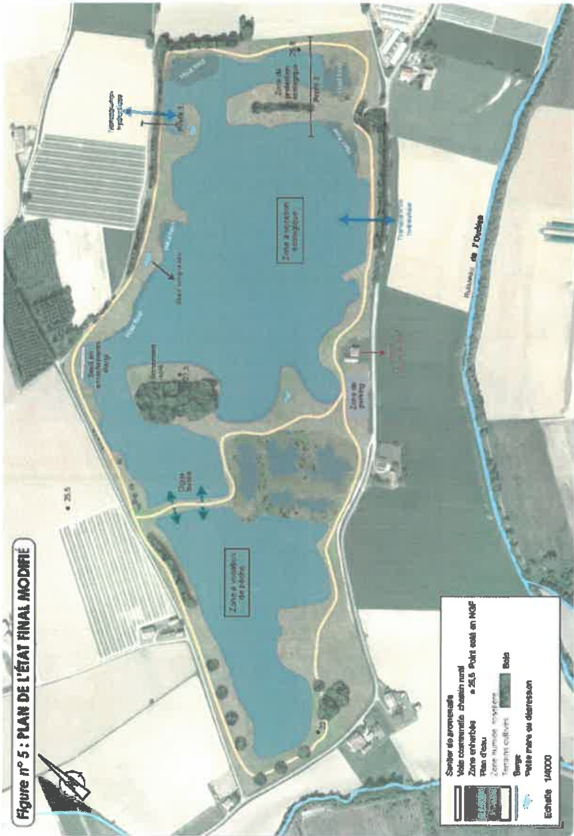
Figure n° 5 : PLAN DE L'ÉTAT FINAL MODIFIÉ