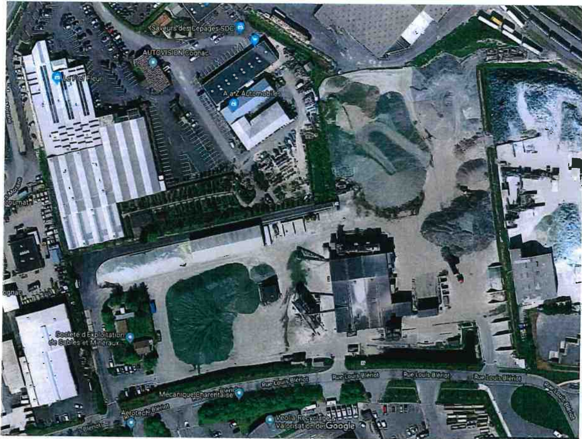
En limite de propriété