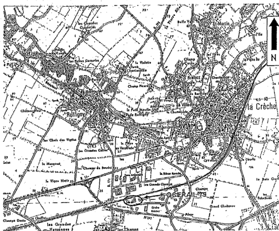
Localisation du site - Carte au 1/25 000 (IGN Saint Malxent l'École - n° 1628 0)